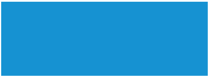
Demi mur 300 x 108 cm